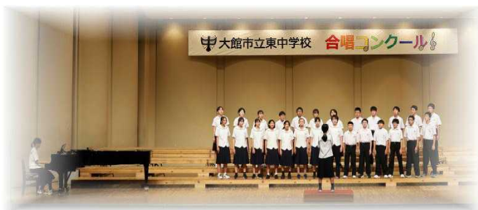
1年生最優秀賞C組「マイバラード」

2日（木）、ほくしか鹿鳴ホールを会場に行われた合唱コンクールでは、東中三大自慢の一つ「歌声」を見事に発揮することができました。保護者の感想には「一生懸命に歌っている姿、楽しそうに歌っている顔に、とても勇気づけられました」「東中生の態度も気持ちよく、とてもよい合唱コンクールでした」「全学年、全生徒が会場の空気をエネルギーに満ちたものにつくりあげていたように感じました」「全校合唱は圧巻でした。涙が出るくらい感動しました」「合唱前後の姿勢、行動、どれをとっても言うことなしです」などがあり、生徒の頑張りが評価されたことを大変うれしく思っています。