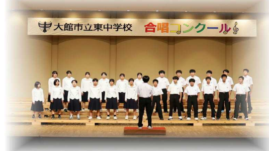
2年生最優秀賞A組「ふるさと」