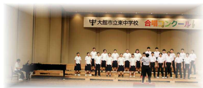
3年生最優秀賞D組「虹」