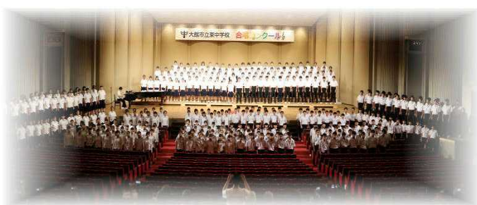
全校合唱「東中賛歌」「時の旅人」